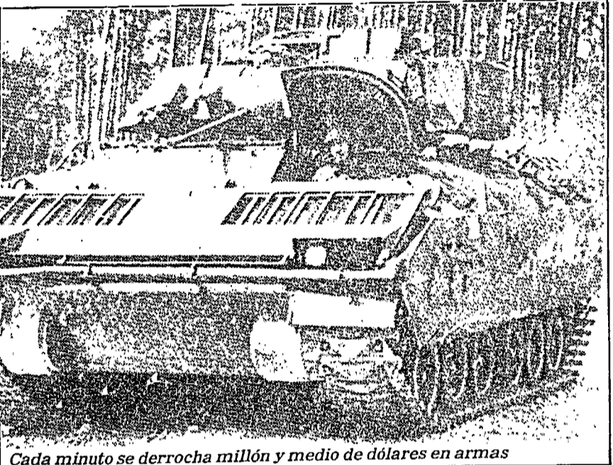
Cada minuto se derrocha millón y medio de dólares en armas

Allí encuentra usted principios, objetivos mecanismos que si se realizaran así fuera siquiera en un cincuenta por ciento, la situación que confrontaríamos sería totalmente distinta. Me atrevo a esperar, puesto que el egoísmo es uno de los principales motores del hombre, que éste llegue a comprender que un egoísmo bien entendido hace indispensable una modificación de las condiciones actuales. No es cuestión que pueda lograrse en 24 horas, pero no debe