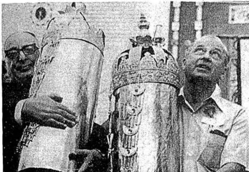
TEL AVIV, Israel, 12 (AP).- El ex-Ministro de Finanzas de Israel, Pinhas Sapir (I) durante las ceremonias de consagración de una nueva sinagoga. Momentos antes de caer víctima de un ataque al corazón que le quitó la vida. A la derecha, Yitzhak Rabin que tomó parte en la ceremonia también. (TELEFOTO).

Albert dijo que los parlamentarios soviéticos aseguraron que su país cumpliría con todas las cláusulas del acuerdo de Helsinki.