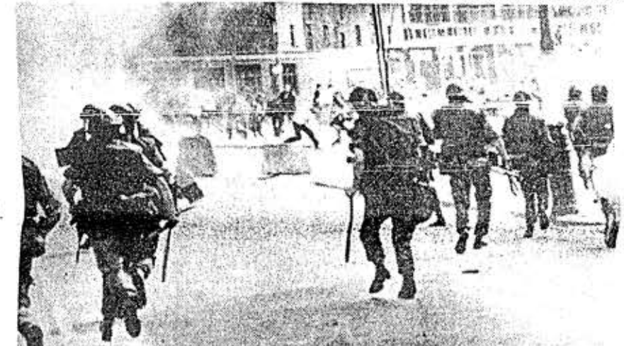
LONDONDERRY, Irlanda del Norte, 12 (AP).- Mientras soldados ingleses avanzan tirando balas de hule para sofocar un disturbio, una multitud de jóvenes delante de ellos trata de protegerse al retirarse a lugares más seguros, en un nuevo estallido de violencia en esta región. (TELEFOTO).

Los diarios capitalinos atribuyen a fuentes en Washington el comentario de que las conversaciones han progresado a tal punto que no es necesario ya que las partes hagan nuevas propuestas, sino ciertas aclaraciones.