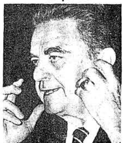
MONTREAL, 12.- El Juez John Sirica gestula ante los miembros de la Asociación de la Barra Norteamericana de Abogados, al hacer recuerdo de las cintas de Watergate y la importancia que tuvo escucharlas detenidamente, como parte del discurso que pronunció hoy en Montreal.