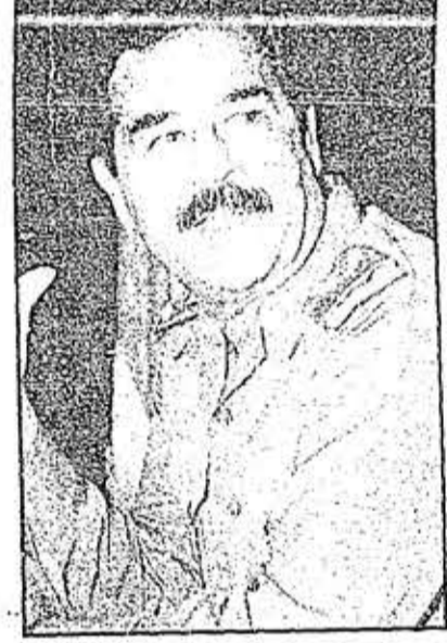
Saddam. Acoso de la CEE.