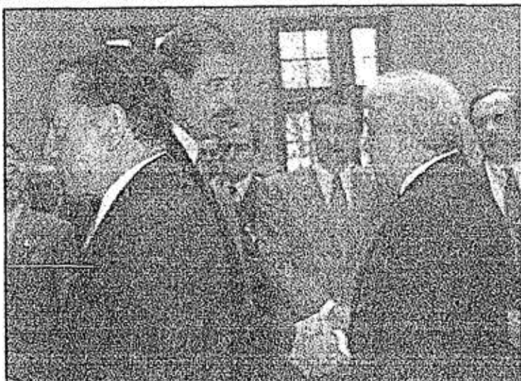
El presidente Fox y el gobernador Cervera se encontraron ayer.