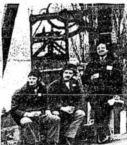
BARNESLEY, Inglaterra, 10 (AP).- Mineros formando un piquete de huelga a la salida de una mina de carbón, toman café esta mañana. Los mineros ingleses declararon huelga general en toda la nación.

Si bien el primer día está reservado para conferencias con su colega austriaco trans- Ver: Echeverría, Pág. 6, Col. 6