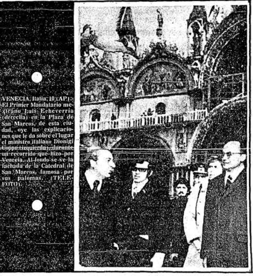
VENECIA, Italia, 10 (AP).- El Primer Mandatario mexicano Luis Echeverría (derecha) en la Plaza de San Marcos, de esta ciudad, oye las explicaciones que le da sobre el lugar el ministro italiano Dionigi Coppo (izquierda), durante un recorrido que hizo por Venecia. Al fondo se ve la fachada de la Catedral de San Marcos, famosa por sus palomas. (TELEFOTO).