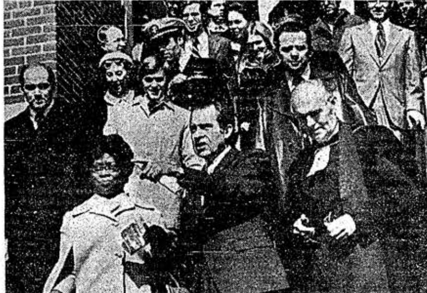
WASHINGTON, 10 (AP).- El Presidente Nixon saliendo de una iglesia presbiteriana hoy domingo, en donde atendió los servicios religiosos, entre un grupo de personas, entre las que se ve al ministro George Docherty (derecha), Mamie Eisenhower (izquierda, tercera fila), Julie Nixon Eisenhower (atrás en medio), Nixon habla con una maestra negra, la señora John Cox. (TELEFOTO).

Aquí, una llamada de larga distancia a Europa cuesta, de persona a persona, 150 pesos los tres primeros minutos; 125 a Sudamérica y 37.59 a Centroamérica. A estas tarifas se les recarga sólo un 20 por ciento de impuesto federal.